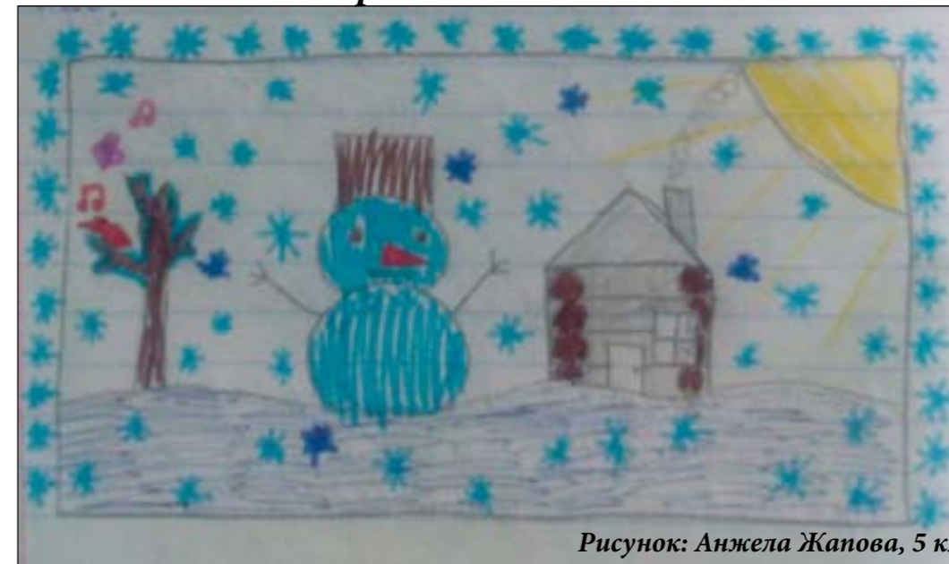
Рисунок: Анжела Жапова, 5 кл.